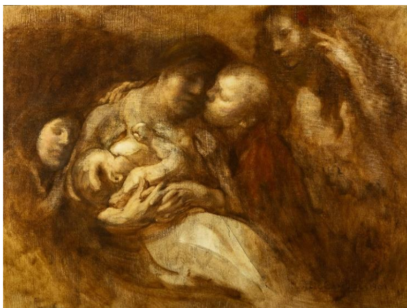
Eugène Carrière (1849-1906)

Au fil des salles, les élèves pourront se familiariser avec de nombreux médiums artistiques : la peinture, le dessin mais aussi la sculpture et la photographie. Ils pourront découvrir la vie d'un artiste important du XIX e siècle et comprendre que les arts dialoguent entre eux ; qu'un sculpteur peut s'inspirer d'un peintre ou qu'un photographe peut faire référence à des toiles dans ses photographies.