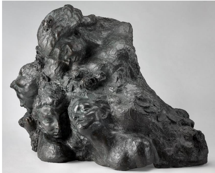
Antoine Bourdelle (1861-1929) Femmes - groupe de quatre têtes, vers 1898 Bronze, 70,4 x 98,5 x 37,5 cm Paris, musée Bourdelle, inv. I1119