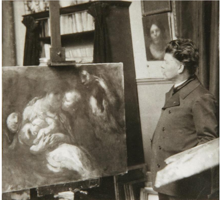
Eugène Carrière dans son atelier, vers 1900