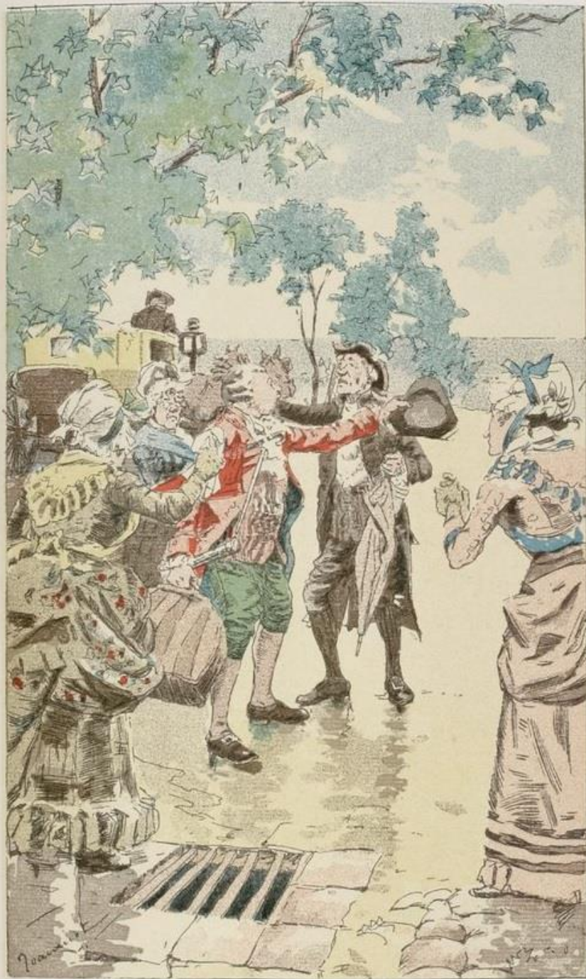
Adieux du Voyageur à sa mère, à ses tantes et à son régent (p. 43).