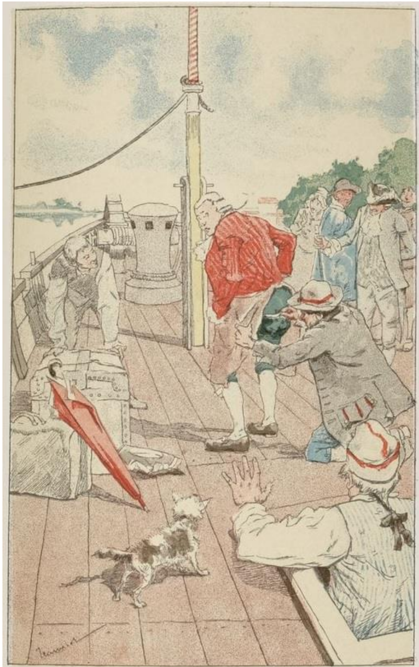
Le Voyageur s'assied sur des cordages nouvellement goudronnés (p. 44).