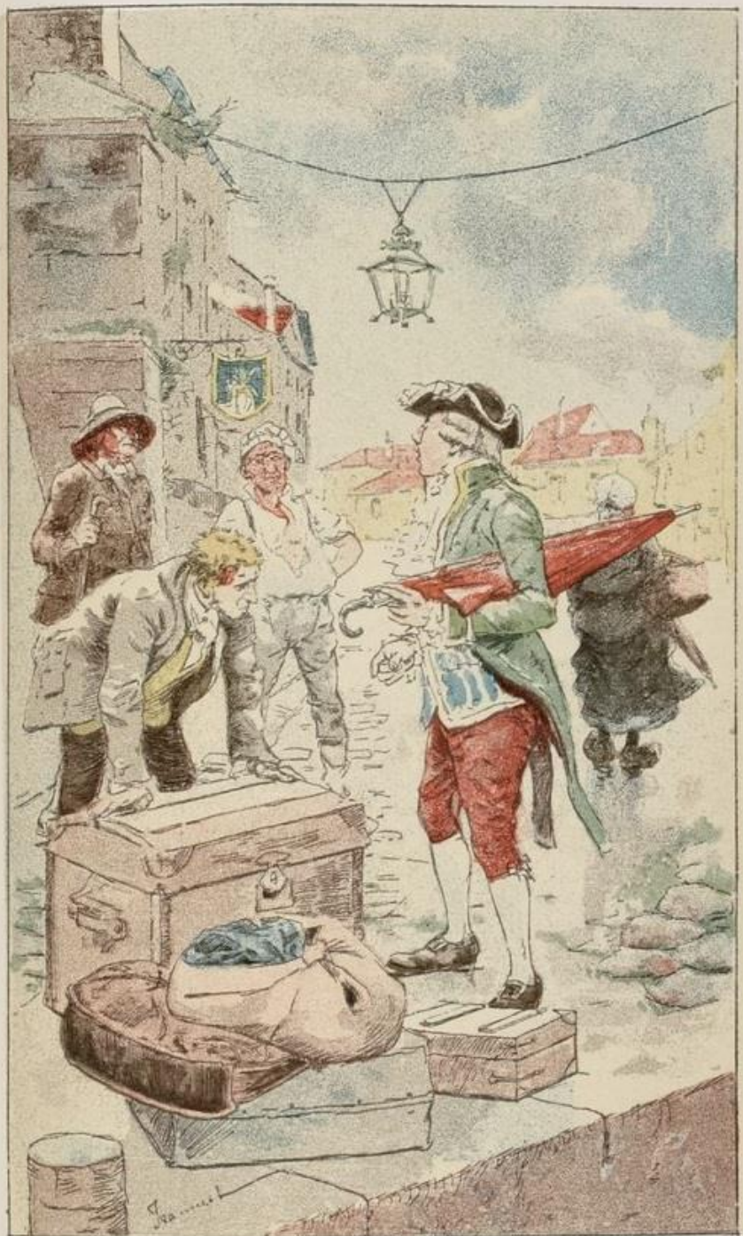
Le Voyageur débarque au port de Sèvres (p. 74).