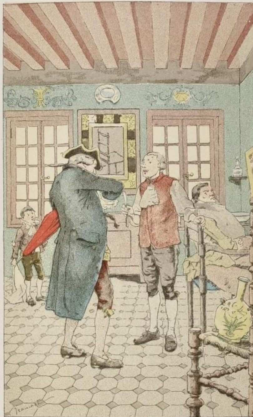
Le Voyageur va payer son perruquier (p. 35).