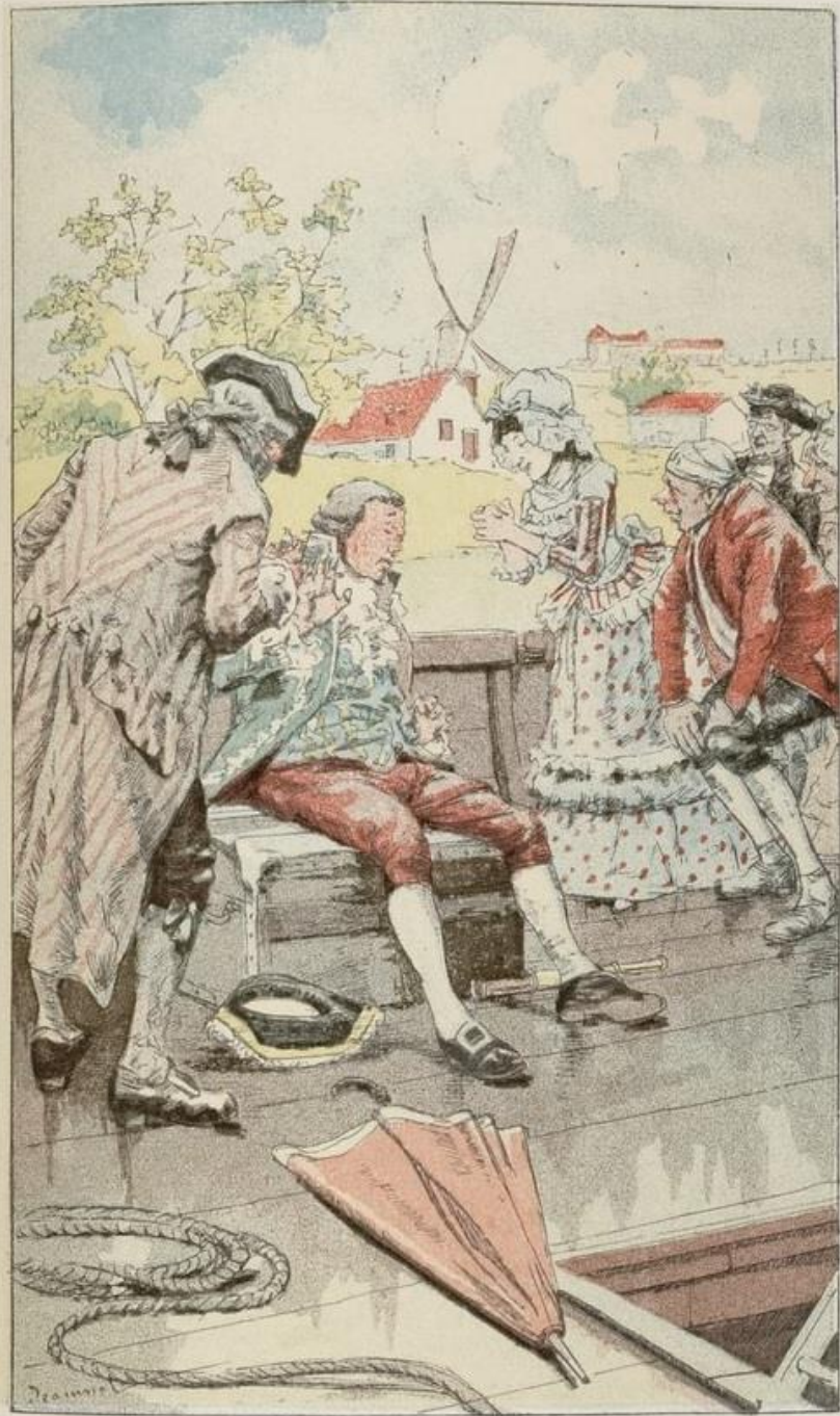
Le Voyageur se trouve mal et est obligé de s'asseoir (p. 68).