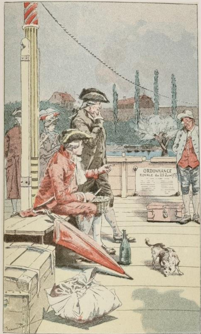
Le Voyageur déjeune assis au pied du grand mât (p. 50).