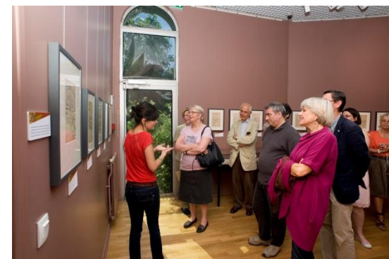
Visite guidée d'une exposition