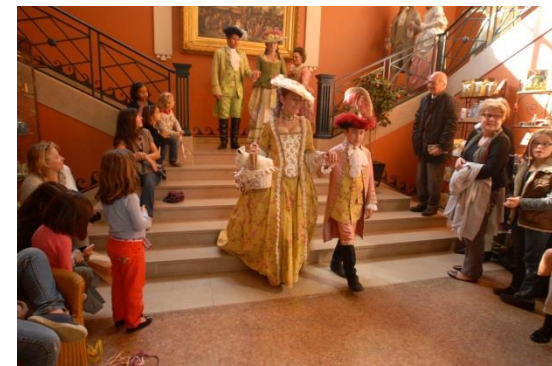
Défilé de costumes d'inspiration XVIII e