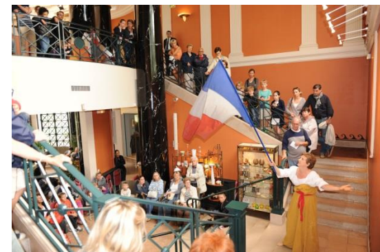
Représentation théâtrale au sein du musée

Vous tous, de Saint-Cloud ou d'ailleurs, qui aimez le musée des Avelines, DEVEZ-AMIS DU MUSÉE !